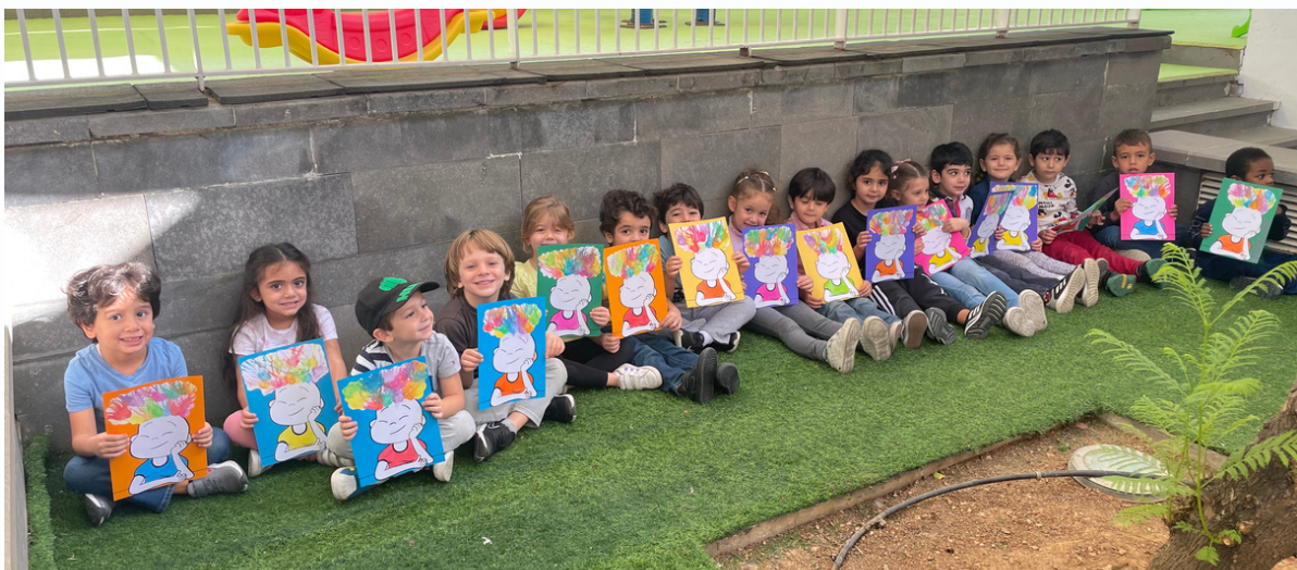
Participation à La Grande Lessive en Octobre 2022 Thème: La couleur de nos rêves